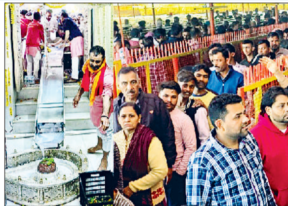
पिहोवा। लाइनों में लगे शिवभक्त।

संगमेश्वर महादेव मंदिर अरुणा में महाशिवरात्रि मेले के दौरान साढ़े तीन लाख से अधिक श्रद्धालुओं ने शिवलिंग पर जलाभिषेक किया। इस दौरान पूरा दिन मंदिर के बाहर लाइनें लगी रही। इस बार खास बात ये रही कि लाइनों में लगे श्रद्धालुओं को जलाभिषेक के लिए पंचामृत युक्त गंगाजल सेवादल की ओर से उपलब्ध कराया गया। करीब 50 हजार लीटर पंचामृत युक्त गंगाजल से अभिषेक किया गया। सेवादल सदस्य बड़े टबों से लोटे में गंगाजल भर का श्रद्धालुओं को थमाते रहे। साथ ही श्रद्धालुओं के लिए गुड़ की भेली, प्रसाद और फूल भी लाइनों में उपलब्ध कराया गया। पूजन के लिए अर्पित की जाने वाली सामग्री को लेकर श्रद्धालुओं को इधर-उधर नहीं भटकना पड़ा। दो एलईडी स्क्रीन के माध्यम से बाहर से ही श्रद्धालुओं को मंदिर के अंदर का पूरा नजारा दिखता रहा।