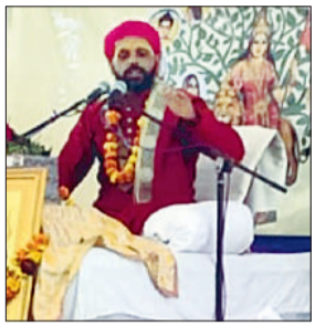
पार्वती की कठोर साधना से प्रसन्न होकर भगवान शिव ने उन्हें अर्धांगिनी स्वीकारा