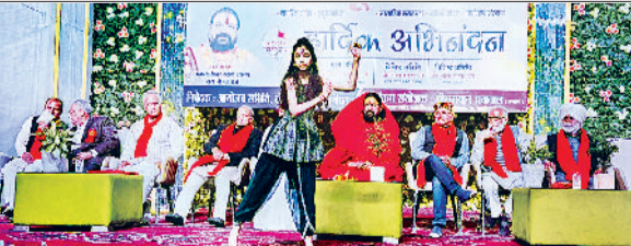
पानीपत। विराट हिंदू सम्मेलन में मंचासनी अतिथिगण।