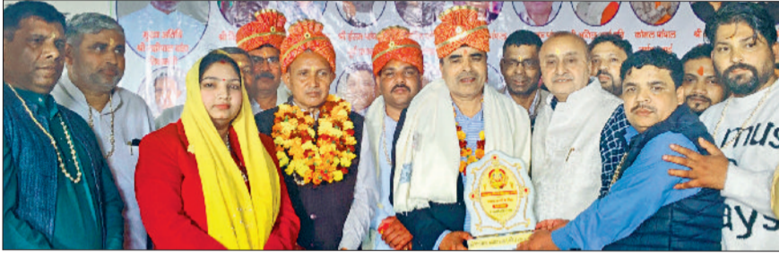
पानीपत। श्री विश्वकर्मा पांचाल सभा के पदाधिकारी हरपाल दांडा की स्मृति चिह्न भेंट करते हुए।