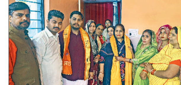
पानीपत। चित्रकूट धाम श्रीराम मंदिर में अतिथियों को सम्मानित करें हुए मेजबान।