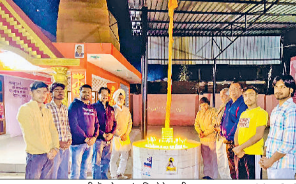
शहजादपुर। पुलवामा शहीदों को श्रद्धांजलि देते ग्रामीण।