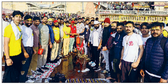
करनाल। गांव सगगा में महाशिवरात्रि पर आयोजित शिव महापुराण कथा व शिव-पार्वती विवाह प्रसंग का भावपूर्ण दृश्य।