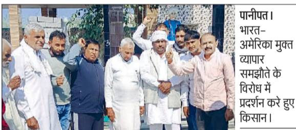
पानीपत। भारत-अमेरिका मुक्त व्यापार समझौते के विरोध में प्रदर्शन करे हुए किसान।