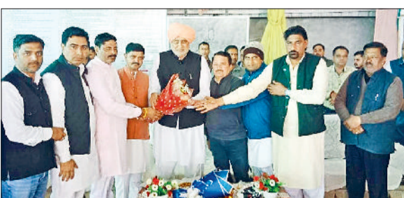
रादौर। जटलाना में कार्यक्रम में कृषि मंत्री श्याम सिंह राणा का स्वागत करते गणमान्य।

हरियाणा के कृषि एवं किसान कल्याण, मत्स्य एवं पशुपालन मंत्री श्याम सिंह राणा ने कहा कि प्रदेश में मुख्यमंत्री नायब सिंह सैनी ने नित्य में ध्यान में रखकर कार्य कर रही है। उन्होंने उक्त शब्द रादौर क्षेत्र