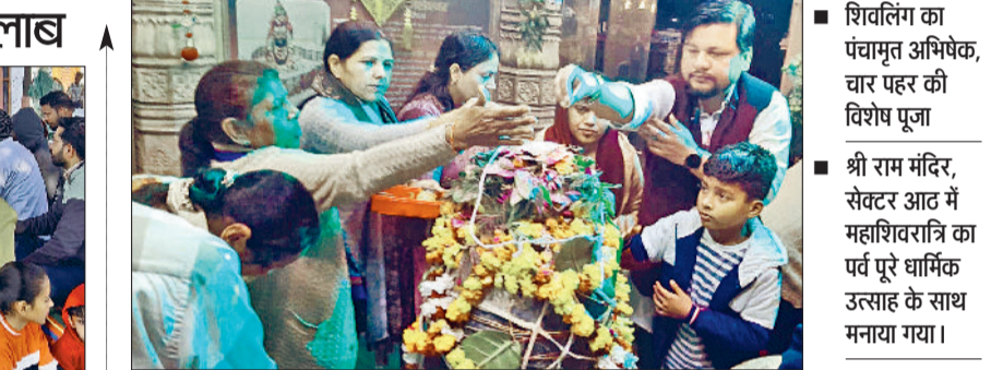
शिवलिंग का पंचामृत अभिषेक, चार पहर की विशेष पूजा