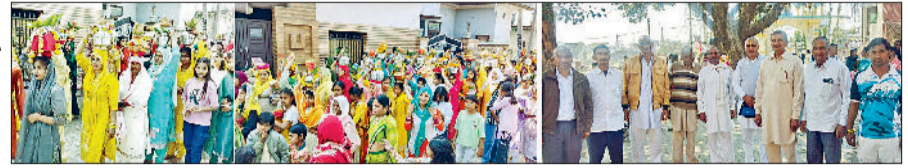
करनाल। घोघड़ीपुर में निकाली गई कलश यात्रा में शामिल श्रद्धालु।